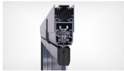
Perfil con sistema compensador