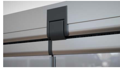
Sistema apertura/cierre extra plano