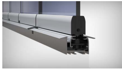
Perfil inferior embutido