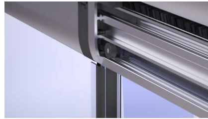
Vidrios con taladro con máxima sujeción para vidrios de 8 y 10 mm.