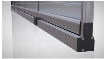
Perfil lateral de cierre con felpa y goma estanca.